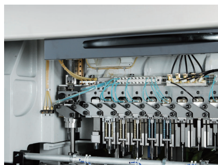
直動式バーチカル トランスファー Direct acting type vertical transfer