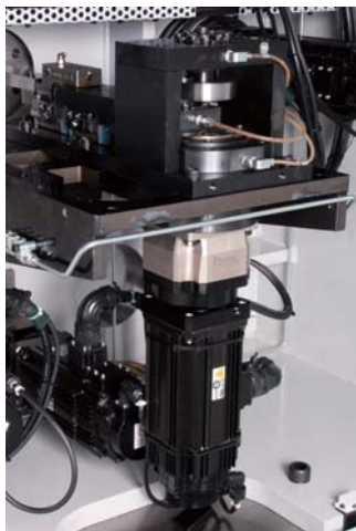
リアスライド Rear slide