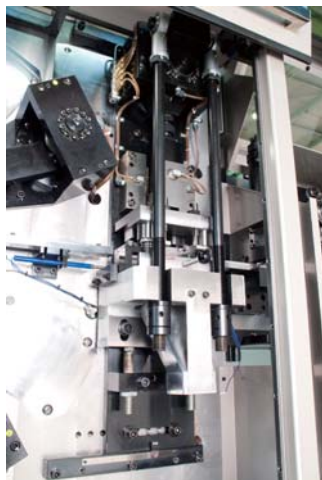
プレスユニット Press unit