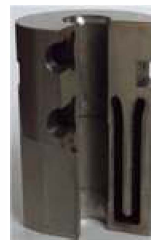
積層造形技術を用いた金型