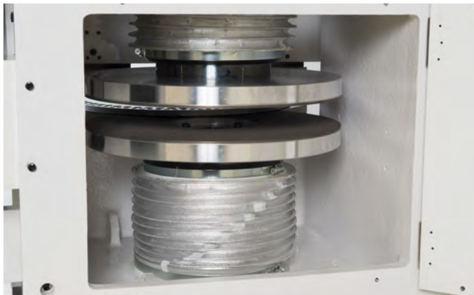
・機械背面カバーを開けることで砥石交換、清掃が容易に行えます