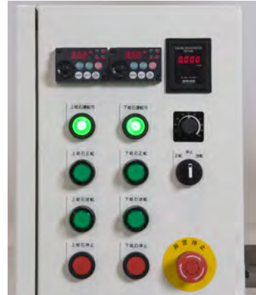
・上下砥石・供給プレートはインバーター制御(標準) ・上下砥石各々で正転・逆転が可能