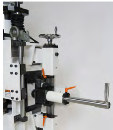
・ドレッシングスライド(オプション)