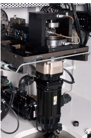
リアスライド Rear slide