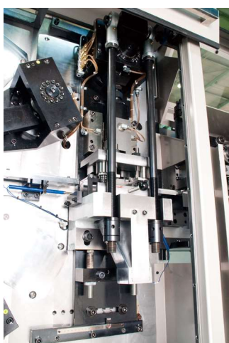
プレスユニット Press unit